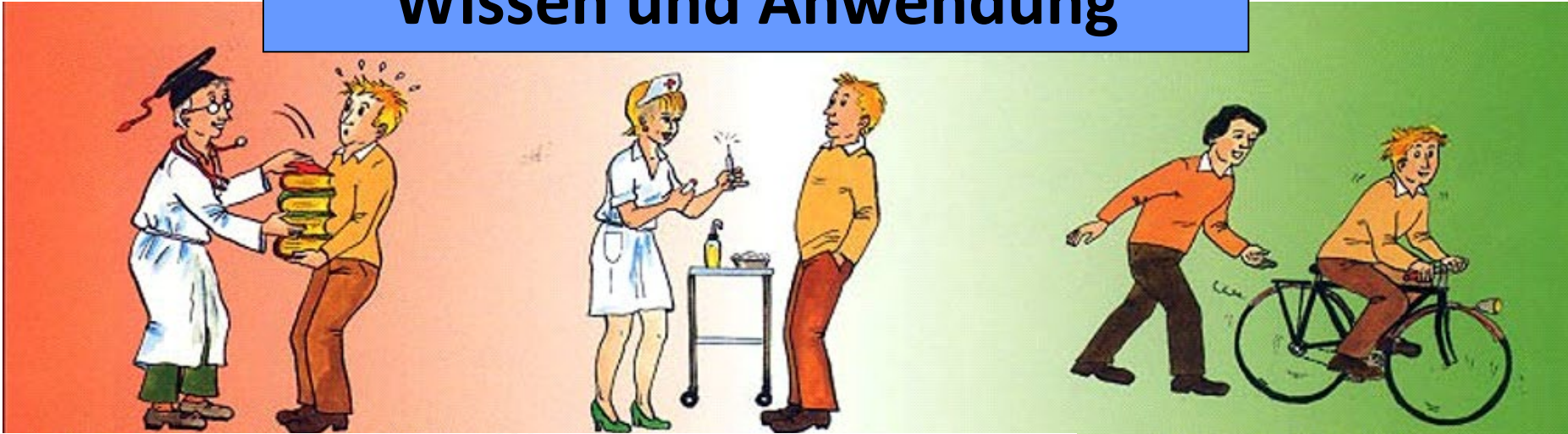
Lernen durch Üben